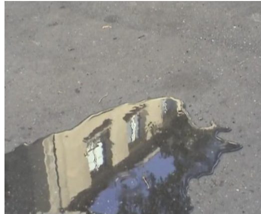
Simon Quéheillard, Vidéos de la série Ce que j'ai sous les yeux