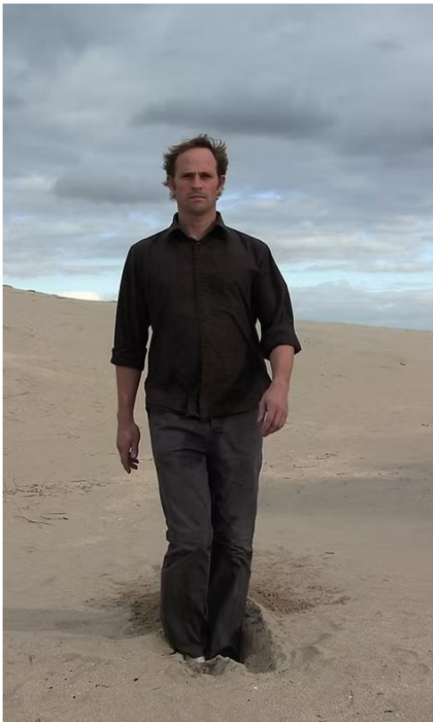
Claude Cattelain, From Sand to dust , vidéo, 3 h 55, 2011