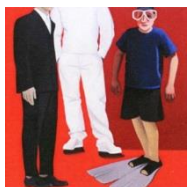
Sylvie Fajfrowska, série Les Rencontres , 2009

L'univers pictural de Sylvie Fajfrowska est à la fois familier et étrange. Les personnages ou les objets sont décontextualisés, représentés sur des fonds abstraits dans lesquels ils semblent flotter. L'artiste dresse un mystérieux inventaire du réel, en mettant en relation des images épurées, jouant sur les rapports d'échelle, les hors champ et les gammes colorées.