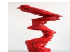
Tony Cragg, Red figure , 2010