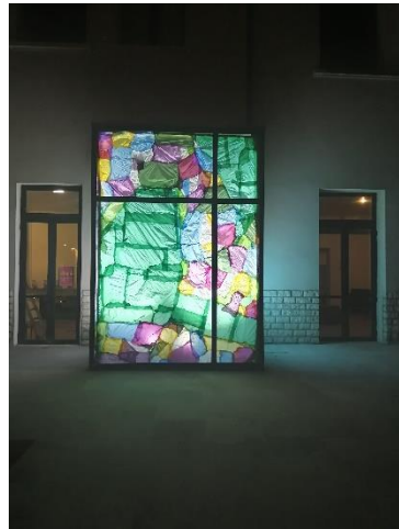
Vitrail de plastique thermo fondu, 2022

Nous vous invitons à découvrir cette œuvre en journée à l'intérieur et la nuit à l'extérieur.