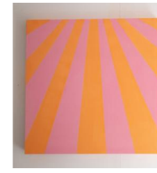
Clémentine Lecointe, Rayon 04 et Rayon 05 , 2019 Peintures à la colle de peau sur toile