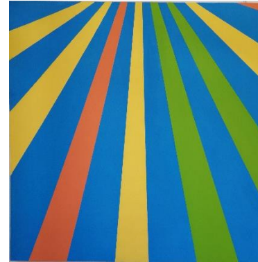
Clémentine Lecointe, Rayon 04 , 2019 Acrylique sur toile