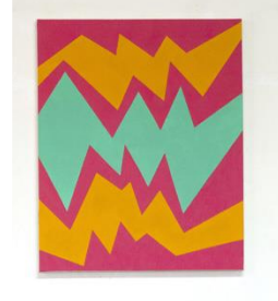
Clémentine Lecointe, Flamme B et Flamme C , 2020 Acrylique sur toile