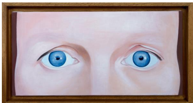
Sylvie Fajfrowska, ISARAY , 20 x 40 cm, 2015, colle et cire sur toile