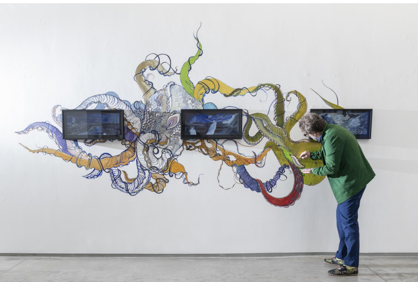
François Andes, Le Détissage de l'Arc-en-ciel