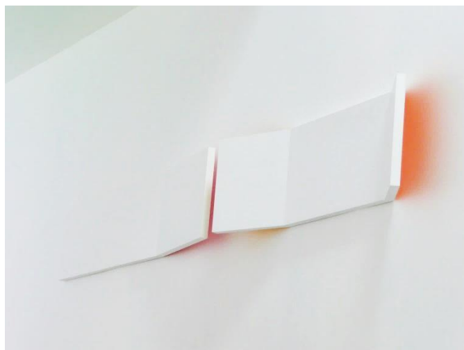
bipan diptyque , 2000, acrylique sur mdf 22 x 182 x 1,8 cm