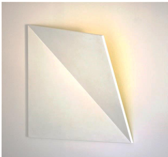
aile , 2008-2009, acrylique sur mdf 79,5 x 79,5 x 1,9 cm