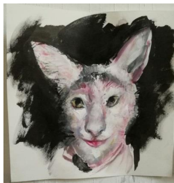
Série des portraits, 2018-2019, acrylique sur papier, 30 x 30 cm (chaque)