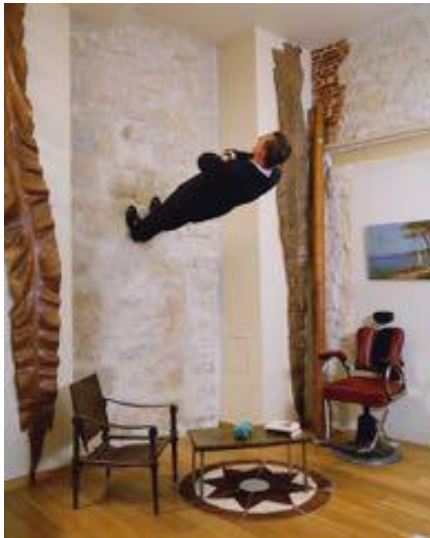
Philippe Ramette Crise de désinvolture , 2003 Photographie couleur 150 x 120 cm © ADAGP, Paris