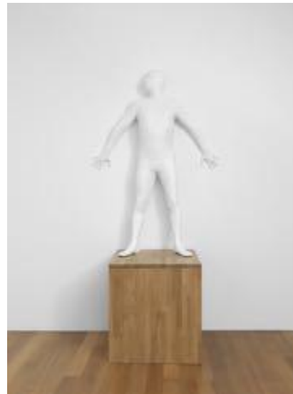
Philippe Ramette Eloge de la discrétion , 2012 Résine peinte Silhouette : 180 x 90 x 45 cm Socle : 90 x 70 x 70 cm Edition unique © ADAGP, Paris