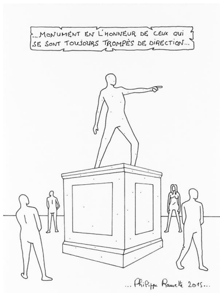
Philippe Ramette ...Monument en l'honneur de ceux qui se sont toujours trompés de direction... , 2015 Encre sur papier : 32 x 24 cm © ADAGP, Paris