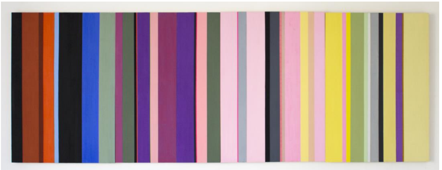
Etretat , 2018,2019, encaustique sur bois,100 x 280 cm