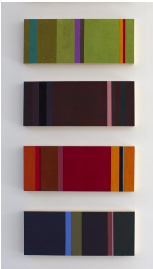
Série Une chambre à part , 2021, encaustique sur bois, 20 x 50 cm chaque