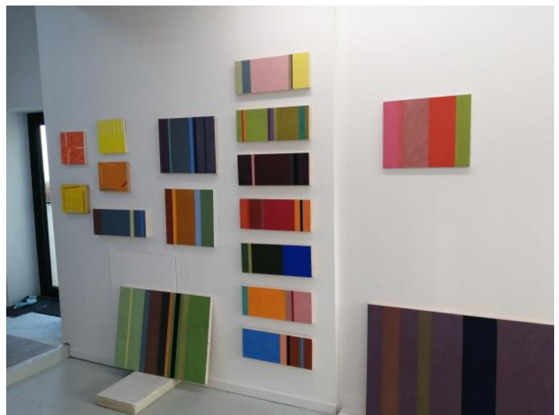
Vue d'atelier, décembre 2020